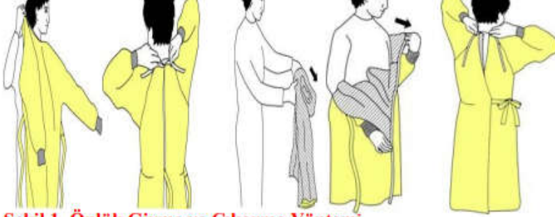
Şekil.1. Önlük Giyme ve Çıkarma Yöntemi