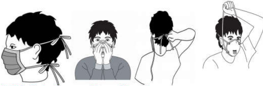
Şekil.2. Maske Giyme ve Çıkarma Yöntemi